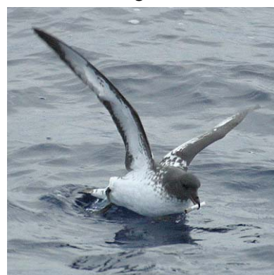
"promotie"-foto voor zwerfvuilprojecten: een Kaapse Duif die de peuk van een filtersigaret uit het water pikt